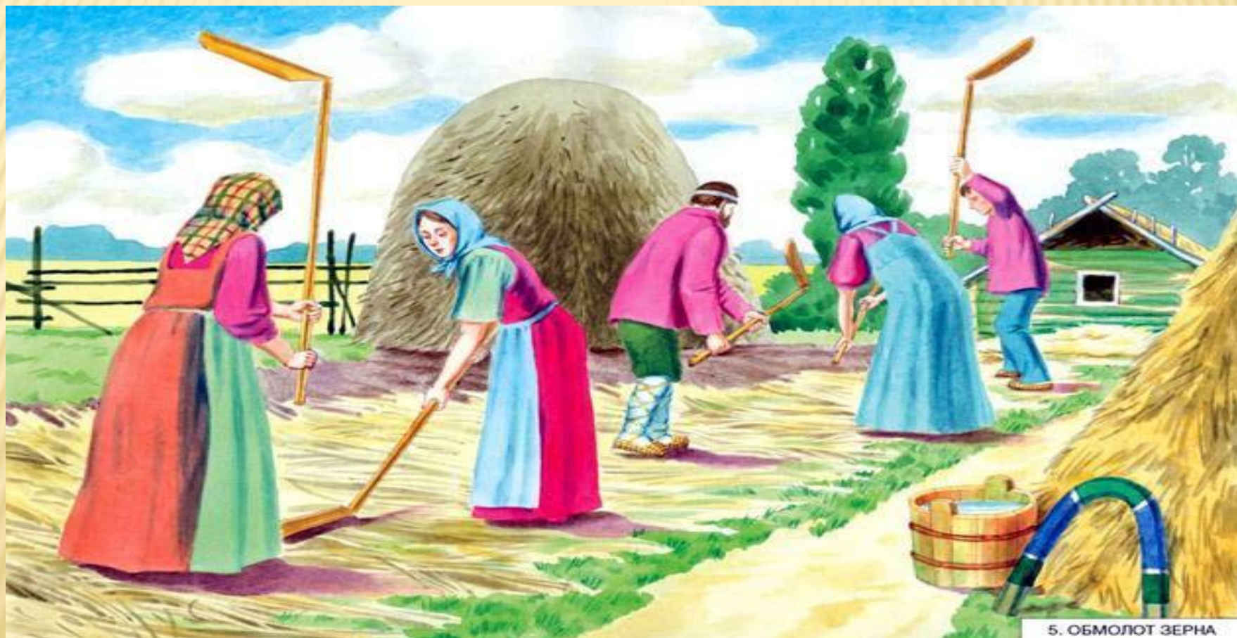
5. ОБМОЛОТ ЗЕРНА